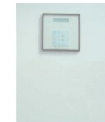
Steuerung bis 30kW