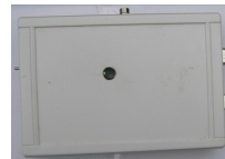
Modem für Laptop oder Service-PC