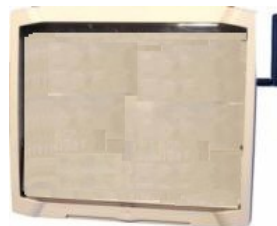
Modem mit Konverter RS232 / RS485