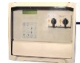
Steuerung bis 4kW